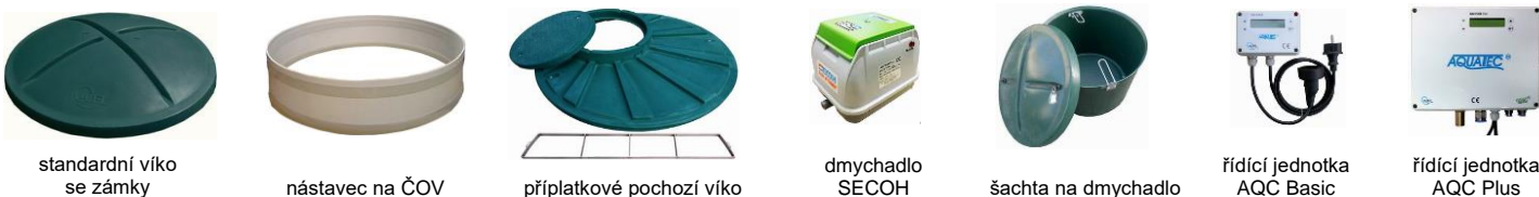
standardní víko se zámků

Firma Aquatec USBF s.r.o. si vyhrazuje právo na změnu výše uvedených cen.