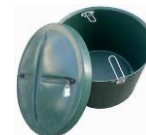
šachta na dmychadlo