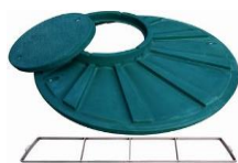
příplatkové pochozí víko